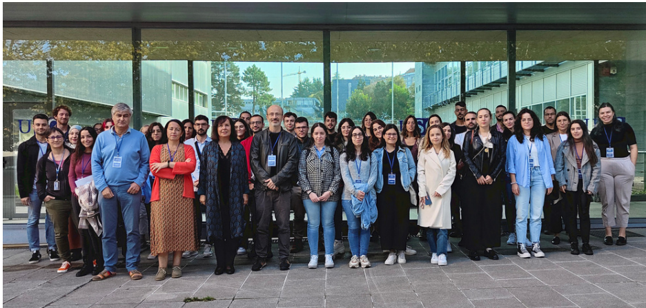
Participantes da VI edición do Simposio en tecnoloxías ambientais (outubro 2022)

O 15 de setembro celebrarase a VII edición do Simposio de Tecnoloxías Ambientais para investigadores de CRETUS.